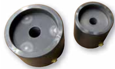
Einfachwirkender Hohlkolbenzylinder für hohe Kräfte auf kleinstem Raum