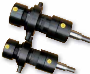
Zylinder mit verstellbarer Schwenkzapfenbefestigung und verdrehbarem Kopf