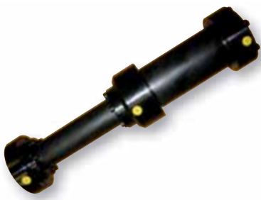
Zylinder mit Ventilplatte und Anbauteilen für Wegmeßsystem mit außen liegendem Glasmaßstab

Druckübersetzer: Sie werden dort eingesetzt, wo höhere Drücke oder andere Medien erforderlich sind.