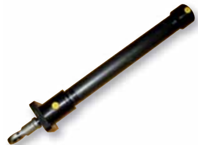
Zylinder für HFC-Flüssigkeit mit Flansch vorne und Gelenkauge

Bauarten sicherlich das richtige Produkt für Ihre Anwendung. Sollten Sie darin nicht fündig werden, beraten wir Sie gerne und fertigen auch ausgefallene Zylinderbauarten und Befestigungsteile für Sie.